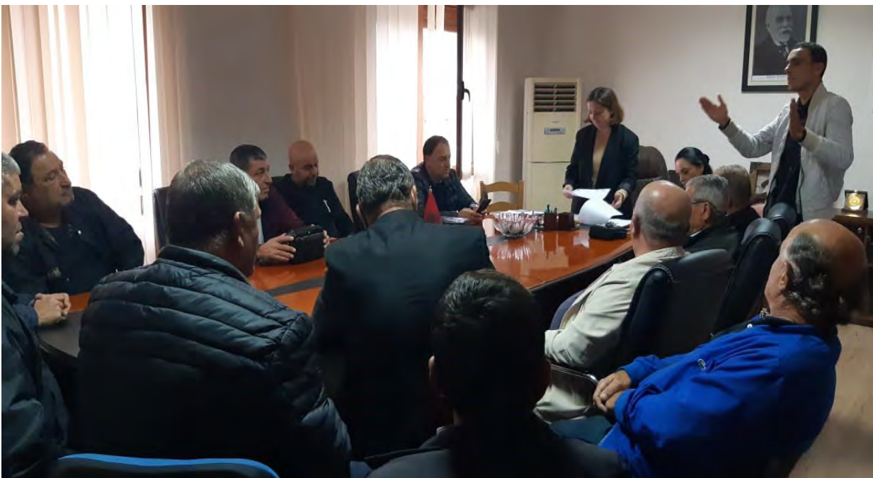
Figura 16: Takim me fermerët vendas në komunën Kashar

Për fermerët vendas në fshatin Yzberish puna në bujqësi është sezonale dhe punët më të qëndrueshme janë në fushën e blegtorisë. Në zonë mund të kultivohen të gjitha llojet e perimeve apo druve frutorë, por sipas tyre kostoja e bujqësisë është rritur dhe nuk është e realizueshme për fitim. Problemi kryesor i tyre në bujqësi është sistemi i ujitjes, i cili mungon. Zakonisht investojnë në puse. Ata i shesin produktet e tyre bujqësore në një treg të madh rajonal, i cili ndodhet pranë kësaj zone, por është një treg privat dhe duhet të paguajnë taksa për të shitur produktet e tyre atje.