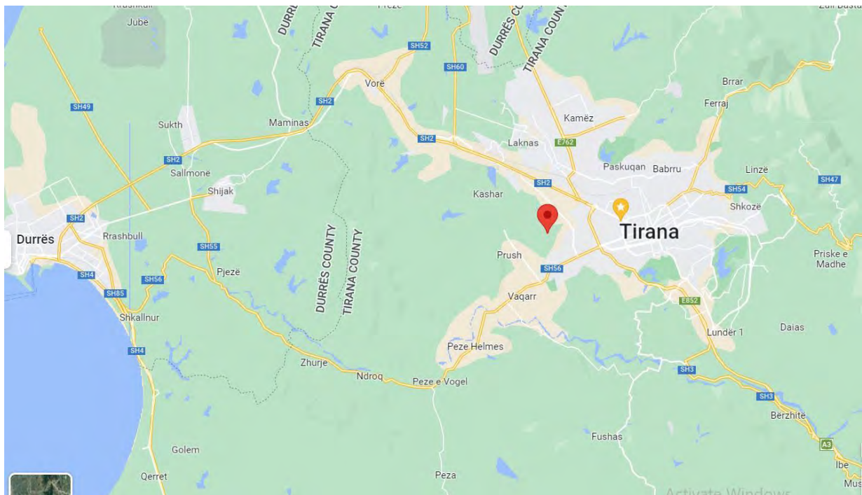
Figura 6: Vendndodhja e dy parcelave bujqësore të konfiskuara në fshatin Yzberish, Bashkia Tiranë

Per lehtesi koordinatat e sakta te parcelave gjenden ne kete link .