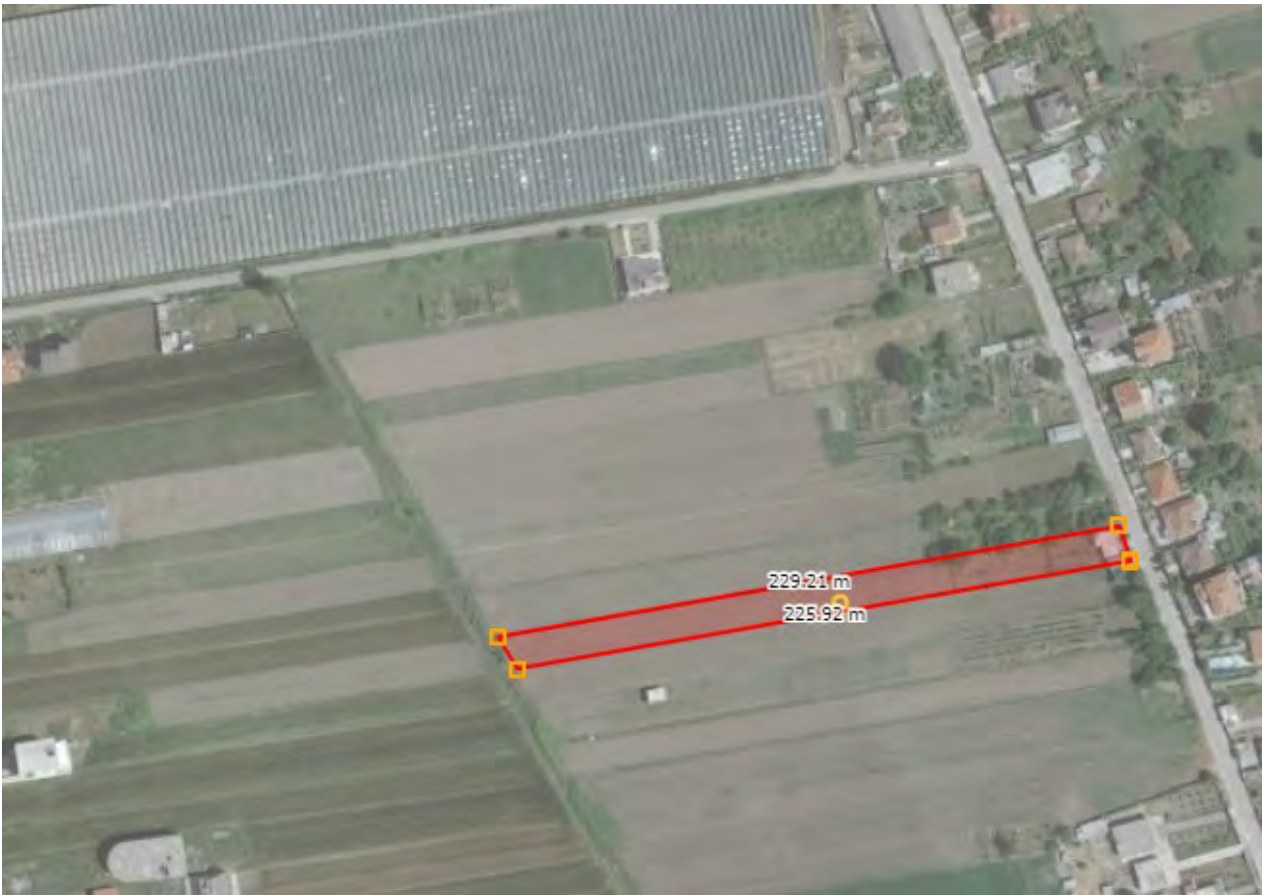
Figura 1: Vendndodhja e pronës në fshatin Rreth, Shijak (Qarku Durrës)

Pasuria nr 27/44 volum 4 faqe 78 me sipërfaqe 2930.0m 2 fshati Rreth, bashkia Shijak zona kadastrale 3225.